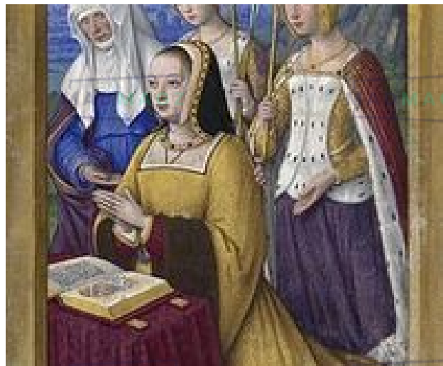
Anne de Bretagne, portant un carcan de diamants et de perles, début du XVIe siècle.

Au Moyen Âge, les bijoux étaient un symbole de statut social, une profession de foi religieuse et l'expression d'un savoir-faire artistique. L'éventail s'étendait de la simple sculpture sur bois aux croix en or élaborées et serties de pierres précieuses.