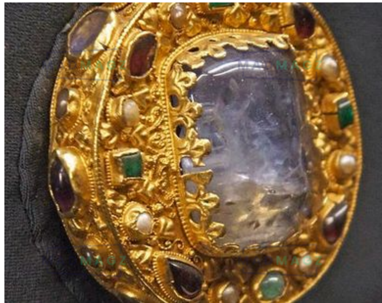
Talisman de Charlemagne, IXe siècle, reliquaire

Les symboles religieux tels que les croix ou les statues de saints, auxquels on attribuait un effet protecteur, étaient très appréciés.