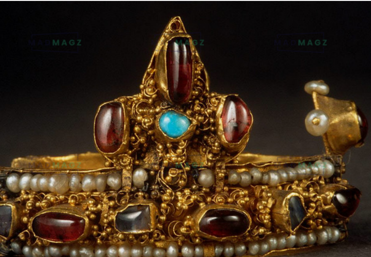
Fragment d'un cercle de tête (deux plaquettes) 1250 / 1300

La diversité des bijoux au Moyen Âge est impressionnante. De la tête aux pieds, pratiquement aucune partie du corps ne pouvait être ornée.