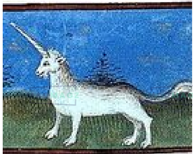
Manuscrit du Livre des propriétés des choses de Barthélémy l'Anglais, au début du XVIe siècle.

Créature fabuleuse avec une unique corne frontale, née de l'imagination des marins au moyen âge. La licorne est décrite comme un petit animal, blanc, qui ressemble au chevreau, ou à une biche et qui est tout à fait paisible et doux. On lui attribue des valeurs morales et sa corne aurait des propriétés médicales (purification de l'eau). Les cornes de licornes sont en fait des dents de narval.