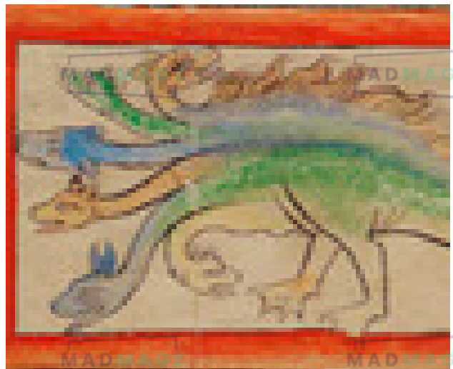
Une hydre, par un inconnu (vers 1250-1260)