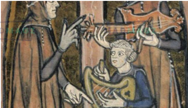
Des instrumentistes avec des luths