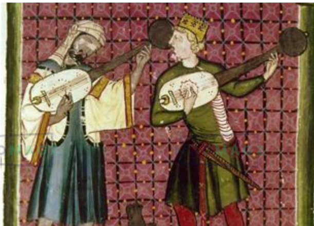
Ménéstrels les Cantigas d'Alphonse X le Sage.