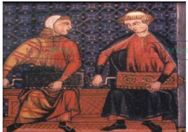
Des Instrumentistes avec des psaltériens.