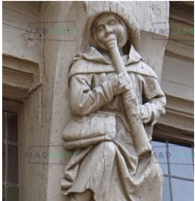
Le joueur de chalémie