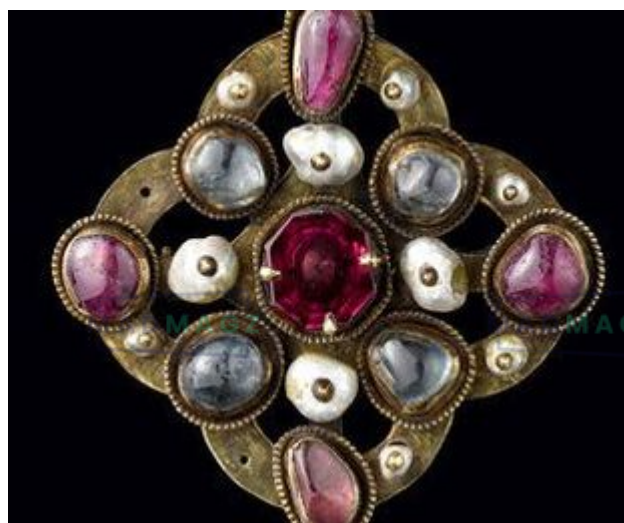
Fermail richement orné XIII-XIVe siècles. https://www.musee-moyenage.fr

Au Moyen Âge, les bijoux n'étaient pas seulement décoratifs, ils reflétaient également le statut social. L'utilisation des bijoux était soumise à des règles strictes. Certains matériaux et certaines formes étaient réservés à des classes sociales spécifiques. Un paysan n'avait par exemple pas le droit de porter des anneaux en or, tandis qu'un noble pouvait se parer de précieuses pierres précieuses. Ces règles reflétaient la structure hiérarchique de la société médiévale.