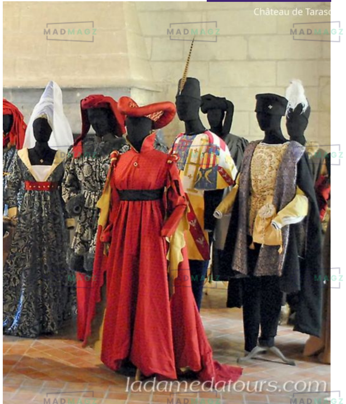
Exposition "La mode au Moyen Âge, Château de Tarascon"