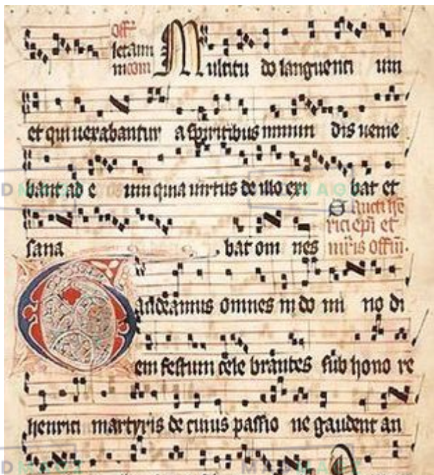
Partition du Moyen Âge