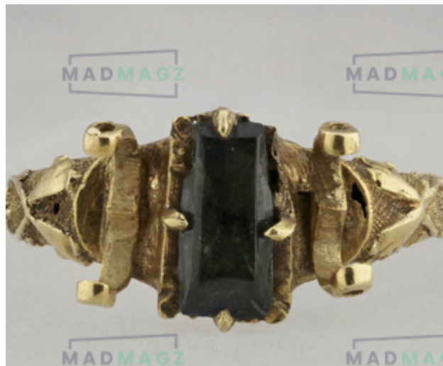
Bague 1385 / 1415

Les bracelets étaient souvent de conception simple, mais pouvaient être décorés de manière très élaborée chez les nobles. Ils étaient fabriqués dans différents matériaux, du simple fer à l'or et à l'argent. Certains bracelets portaient des inscriptions ou étaient ornés de pierres précieuses.