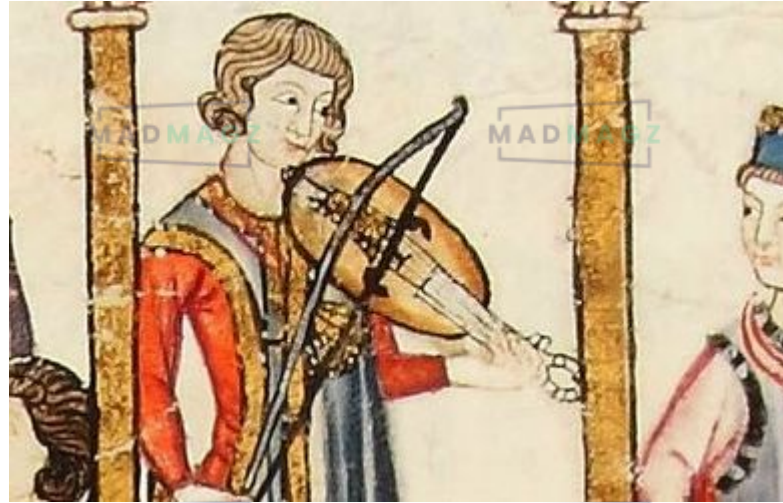
Un joueur de vièle, enluminure, XIIIe siècle