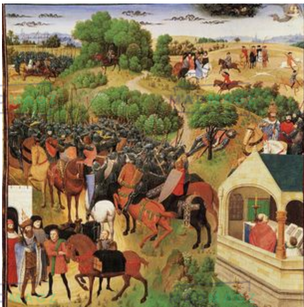
Huit moments de la Chanson de Roland

médiévale de l'épopée ; ce sont de longs poèmes narratifs chantés, célébrant les hauts faits (c'est le sens du mot « geste », du latin gesta), les exploits guerriers de héros, chevaliers français le plus souvent, devenus des personnages de légende.