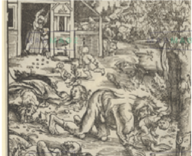
Le loup-garou, par Lucas Cranach l'Ancien, vers 1512, gravure sur bois, Cotha, Herzogliches Museum.

Légende héritée de l'antiquité où des humains maudits se transforment à la pleine lune en loups sauvages avec des yeux brillants et des griffes acérées. Ils errent la nuit, tuent hommes et animaux. Ils sont maudits et accusés de pactes démoniaques. Ils étaient souvent traqués et exécutés par des villageois qui croyaient éliminer un agent des forces du mal